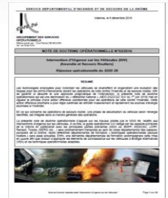
Note de doctrine opérationnelle N° 02/2016 IUUV