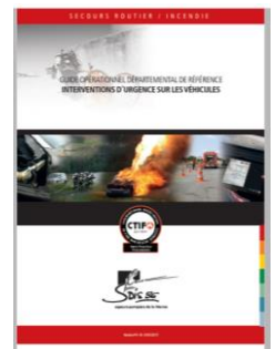
GODR SDIS 86 iuv.sd86.net